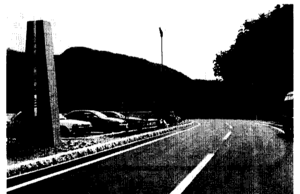
観光道路「かまふせパノラマライン」が開通!! 但し、防衛庁専用道路の舗装改良工事のため釜臥山展望台は、7/18～7/26の期間以外は利用できません。