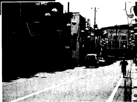
活性化が期待される JR大湊駅前

隣りに建設中のホテル「フォルクローク大湊」が7月の下旬にオープンの予定です。このホテルは、三十代、四十代のファミリー層がゆつたりと滞在でき地域のふれあいを大切にする真に豊かな「新しい旅」を提案し、しかも、お一人様五千円程度(連泊)からご利用できるホテルとなっております。当JR盛岡支社管内では「フォルクローク遠野」・「ファミリーオオ石」・「フォルクロークいわて東和」に次いで四番目となっております。