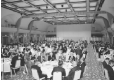
平成13年新年祝賀会 平成13年1月10日 参加者 400名