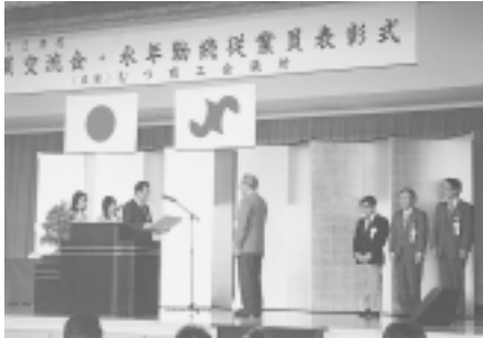
会員交流・永年勤続者表彰 平成13年1月25日 参加者 100名 受賞者 22名