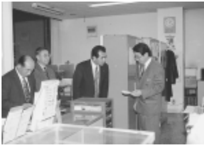
市内金融機関 ・年末の商工業者の資金需要に対し、融資申込企業に迅速な対応をしていただきたい

青森県知事へ ・下北半島縦貫道路の早期完成について ・原子力発電所設置に伴う地元発注の促進について ・本州と北海道の連携を支える「津軽海峡軸」の形成について むつ土木事務所長・むつ市長へ ・大平町一部商店街の冠水に係わる、側溝の早期改修について 東北電力東通原子力・発電所建設所長へ ・市内商工業者の東通原発に係わる発注額拡大と下請け・元請け契約に伴う安全管理費、労務費等の経費の改善について