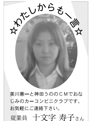
美川憲一と神田うののCMでおなじみのカーコンビニクラブです。お気軽にご連絡下さい。