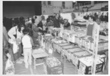
「第3回産業まつり」のようす

協賛事業 十三日(土) 午前十時三十分、市内中学校吹奏楽部演奏会 十四日(日) 午後十二時三十分、大正琴演奏会 (琴遊会、千姫の会) 午後十三時十五分、日本舞踊の集い(花柳智香社中、他) 会場はもと以下北文化会館大ホール