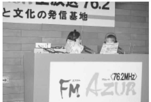
FMアジュール特別番組