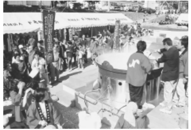
かさまい鍋ふるまい

け、地場産品の販路拡大を図るとともに、体験イベントとして、木工品の製作や煎餅焼きの体験、お菓子の実演販売等を実施した。また、十四日に実施した「かさまい鍋」はアワビ、ホタテの二種類のつみれが入った豪華版で、販売前から長蛇の列が出るほどの大盛況であった。