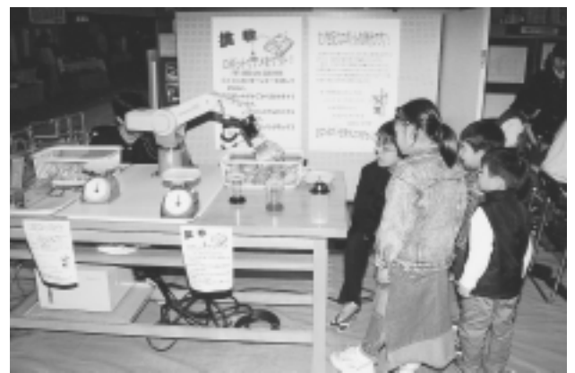
ロボット操作体験