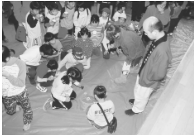
バインブレード大会