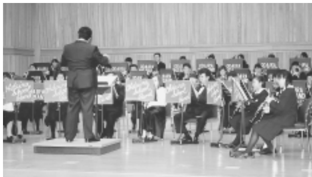
むつ市内中学校吹奏楽演奏会