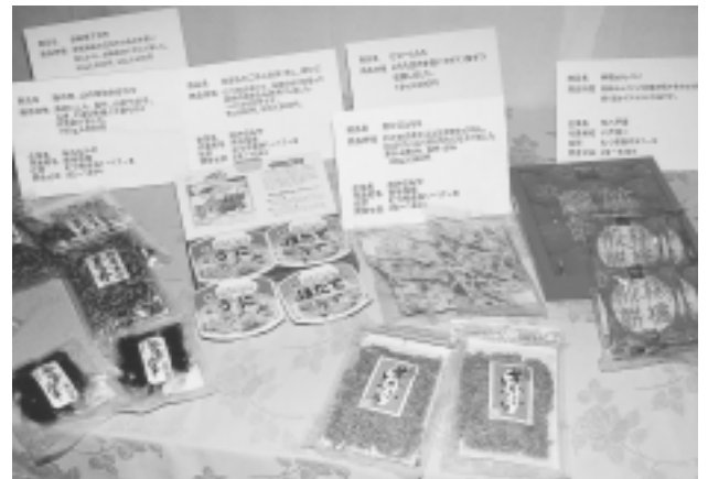
新商品展示コーナー