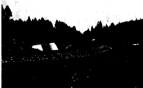
原水施設工事現場→