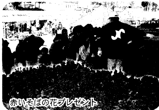
赤いそばの花プレゼント