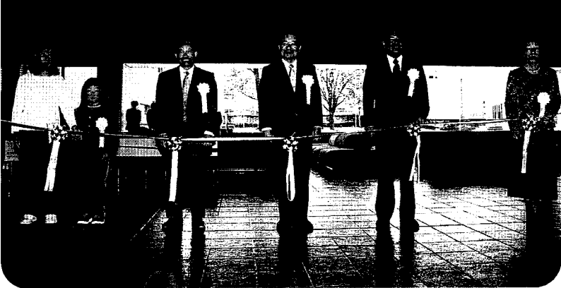
開会式テープカット

去る10月14日(土)、15日(日)の2日間に亘り、むつ市民体育館において、平成12年度「第3回産業まつり」が開催されました。当日は天候にも恵まれ、会場には、むつ市内会員事業所の出店、郡内3町村(大間町、大畑町、東通村)の特産品販売の他、手作りせんべい体験、むつ下北の特産ラーメン(とろろこんぶ、焼干し、コンブ)、新技術開発企業紹介、むつ工業高校のロボット展示など35のコーナーが設けられ、2日間で約10,000人の来場者で賑わいました。