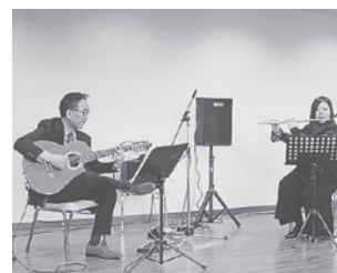
会員交流会/リトルバード&あさか