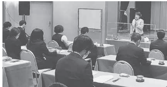
セミナーの様子 はねやホテル

セミナーでは、第一印象の重要性、身だしなみ、お客様応対と訪問マナーなどを学んだ。また、電話応対では電話の基本の受け方やかけ方。電話応対の基本フレーズ。名指し人不在時の受け方などロールプレイングを通じて実践した。受講者からは「電話での要望に応えることが出来ないときの断り方が参考になった」といった感想が寄せられた。