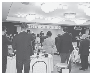
会員交流会/会場の様子