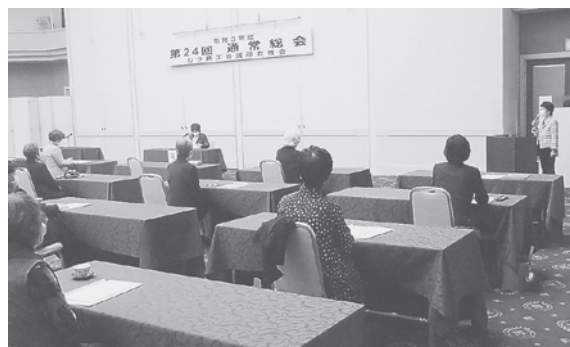
女性会の総会の様子