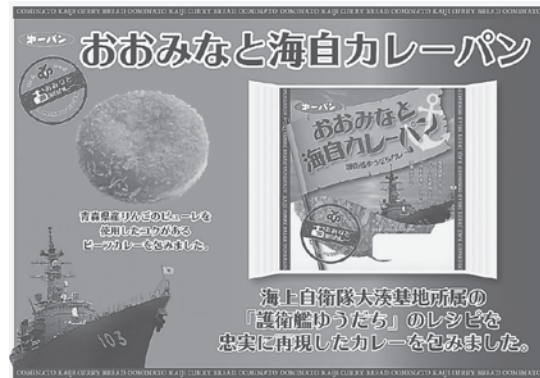
第一パンが開発した「おおみなと海自カレーパン」のパッケージ

これに関連してむつ市は、4月30日にむつ市庁舎において、第一パン社とプロモーション等に関する包括協定をオンラインにて締結した。