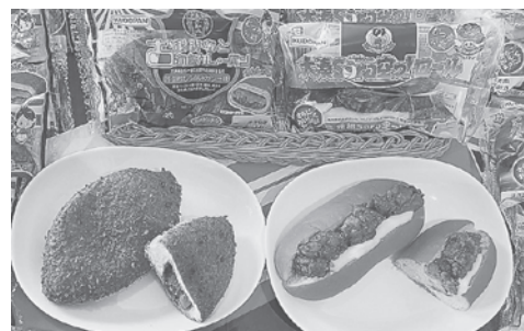
完成した新作「第5弾大湊海自カレーパン」(左)と「第2弾・大湊Sora空っ!ロール」

両商品は7月24日から県内、8月1日からは東北6県のスーパーなどで販売されている。