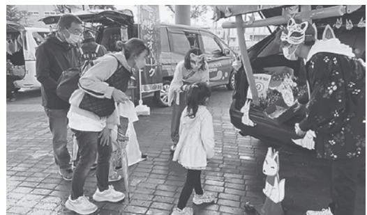
ハロウィンパーティーの様子

10月10日、むつ来さまい館とイベント広場を会場に、3年ぶりとなる「ハロウィンパーティー」が行われました。 あいにくの悪天候で仮装パレードは中止となりましたが、会場には家族づれ約500人の来場があり、子どもたちが思い思いの衣装に身を包み、「トリックオアトリート！」と元気に声をかけ、お菓子をもらいながらゲームやものづくりを楽しみました。 雨風の強い中、出店及びボランティア参加をいただいた皆様、ありがとうございました。