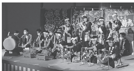
下風呂郷土芸能保存会