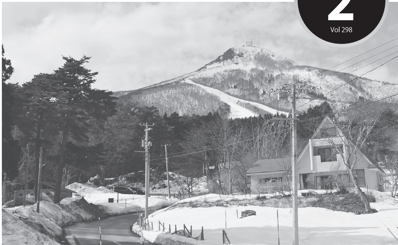
<今月の一枚> 釜臥山スキー場