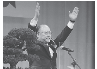
万歳三唱／山形むつ市消防団長