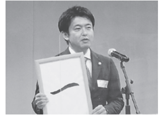
年頭挨拶／宮下市長