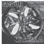
ホタルイカのイカスマパエリア