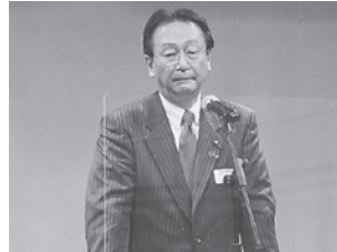
来賓祝辞／江渡衆議院議員