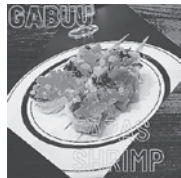
エビのピンチョス