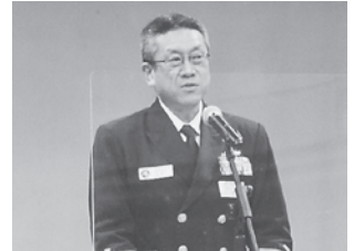
来賓祝辞／泉大湊地方総監