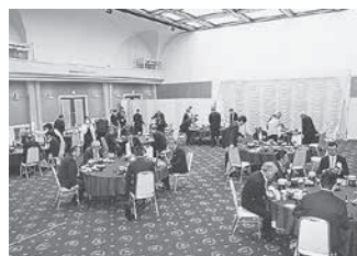
会員交流会 / 会場の様子