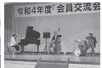
ピアノトリオによるミニライブ