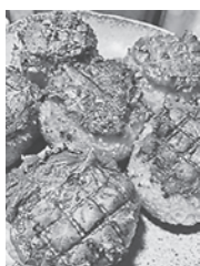
当店イチオン 焼きおにぎり 250円