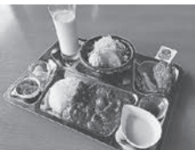
大湊海自カレー(護衛艦おおよど) ¥1,200