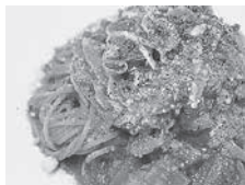
ラム肉のトマトソースパスタ ¥900

コンセプトは、下北半島の恵まれた食材を使った、ジャンルという枠にとられない料理とおいしいお酒。 むつ湾の食材はもちろん、大湊海自カレーなどの当店でしか味わえないメニューもご用意しております。