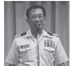
山口第3掃海隊司令より お礼の挨拶