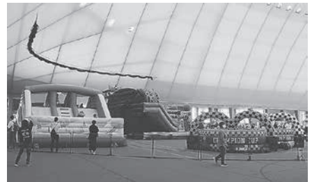
大人気！ふわふわ遊具パーク