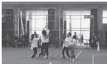
チーム対抗大運動会