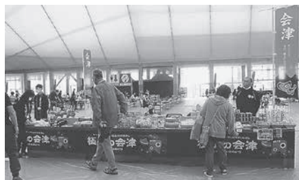
各種展示販売ブース (ドーム内)