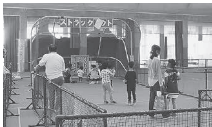
スポーツ体験イベント