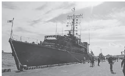
あおしま一般公開