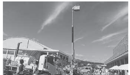
はたらく自動車 (高所作業車)