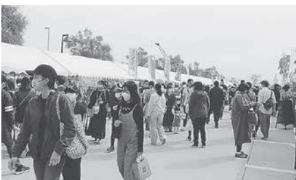
飲食ブース (ドーム外)

などが行われた。湾内クルーズは両日各4回、定員60名で実施されたが、いずれの回も満員となる盛況ぶりであった。