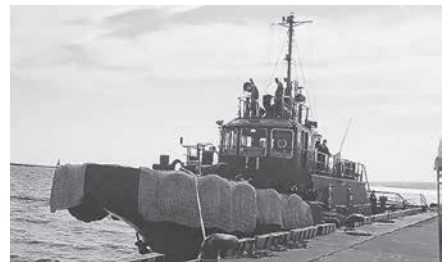
タグボート湾内クルーズ