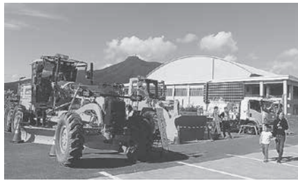
はたらく自動車 (建設重機)