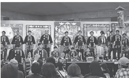
田名部まつり (五町) ステージ