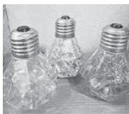
LEDライトキャンドル