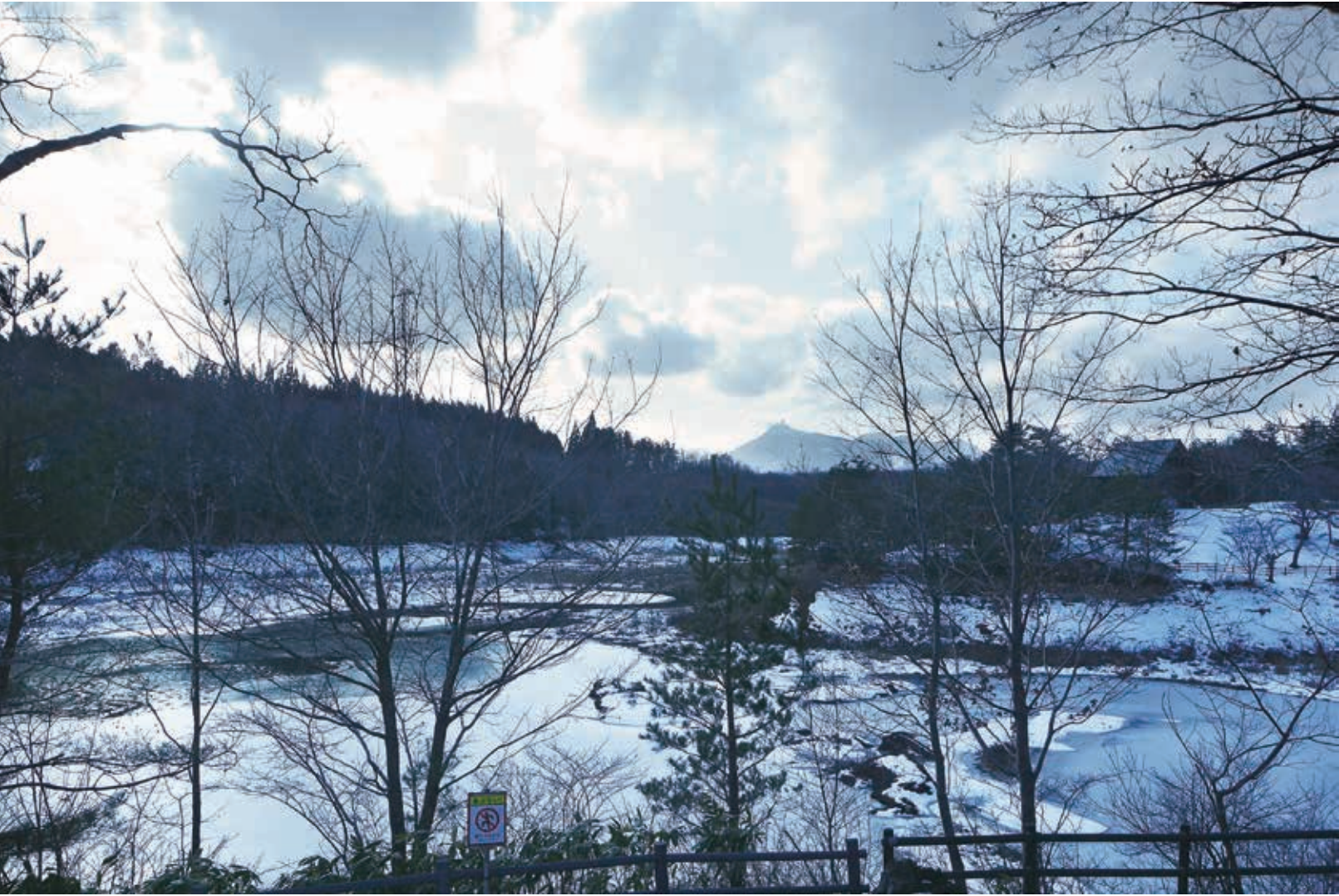
<今月の一枚> 冬の早掛沼公園