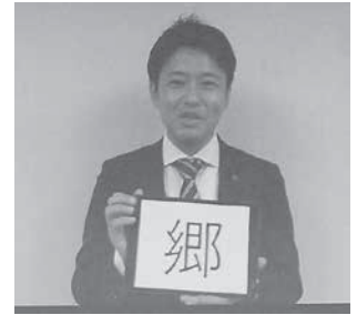
ビデオメッセージ／宮下知事