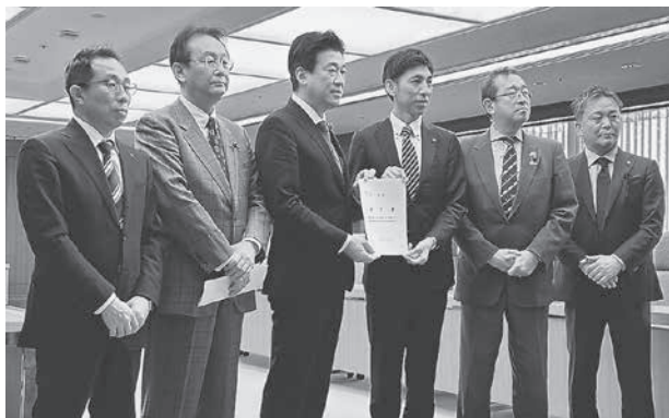
左から、山内副会頭、江渡衆議院議員、木原防衛相、山本市長、津島衆議院議員、内田会頭

来年度末までに横須賀基地に統合される予定の大湊地方隊の事務用品調達業務については、中央の民間業者への一括委託が検討されている。山本市長は、新たな調達の仕組みについて「商いの自由を阻害するものであり従来の官民契約を希望」と反対の意向を伝達。また、木原防衛相は「地元へ寄り添う」などと述べ再度検討する姿勢を示したという。