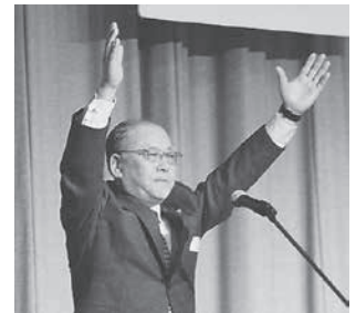
万歳三唱／山形消防団長