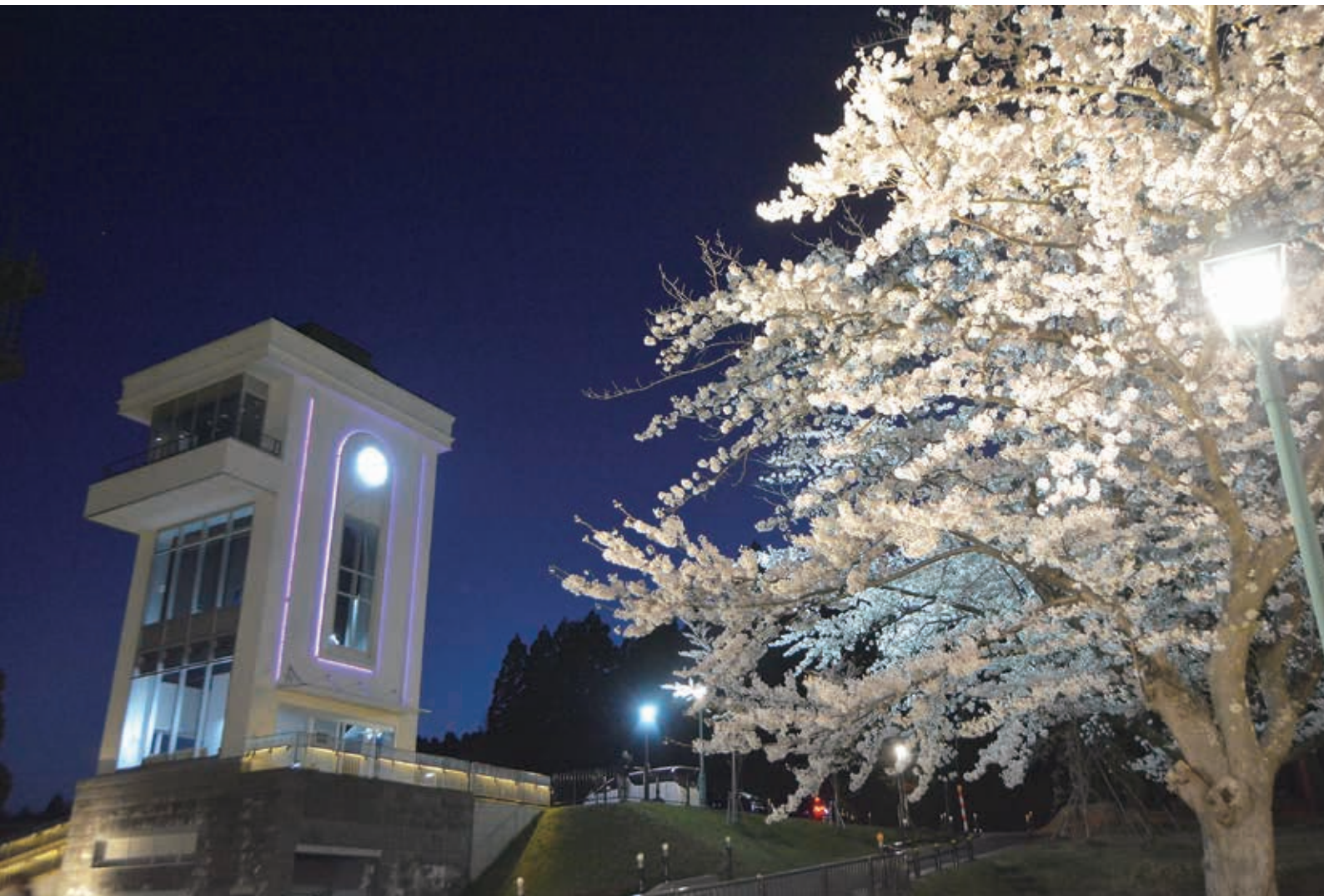
<今月の一枚> むつ市桜祭り (水源池公園展望台)