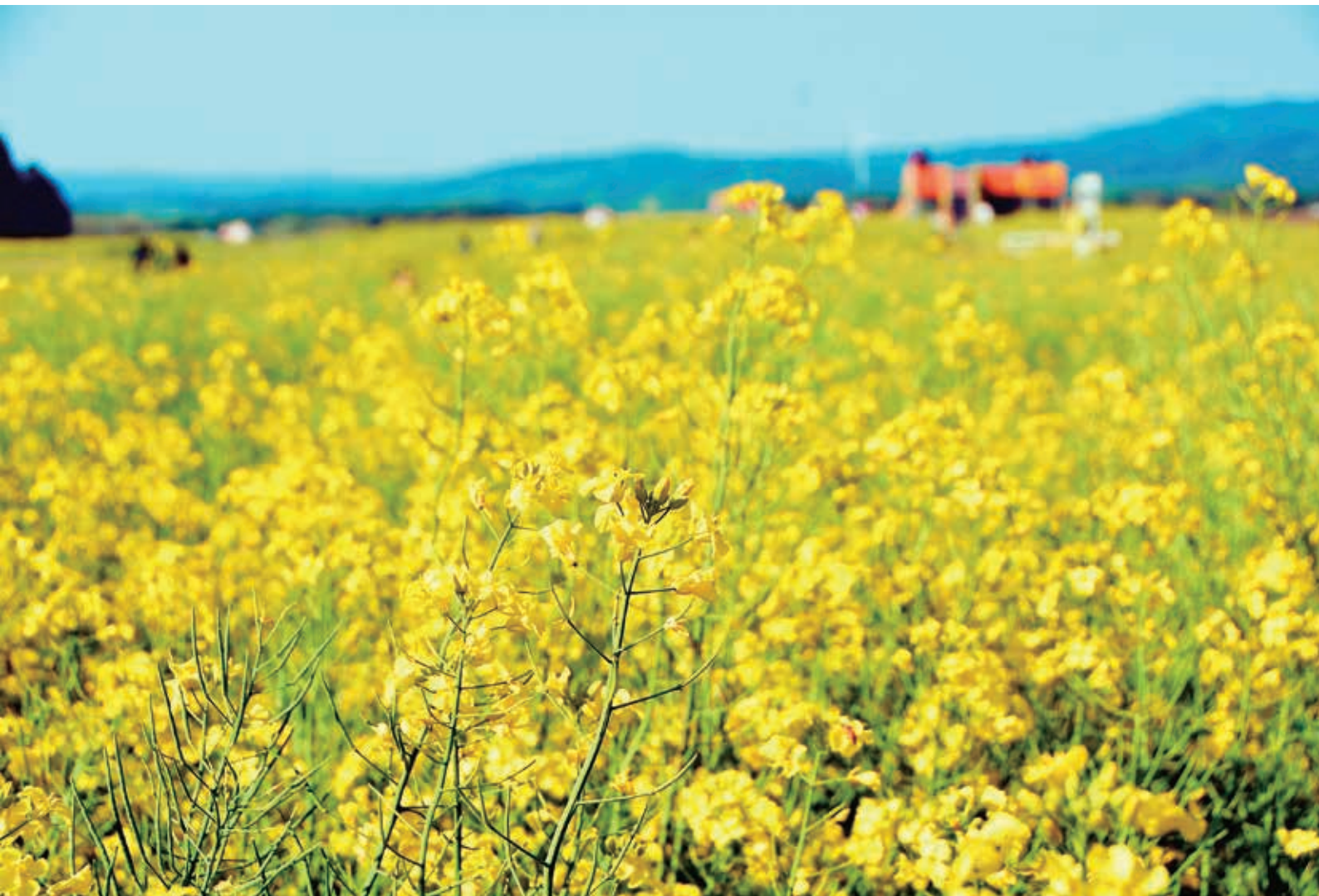
<今月の一枚> 菜の花まつり (横浜町)