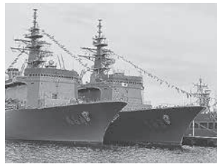
大湊港に入港した掃海母艦「うらが」【ぶんご】総監部第一突堤 (撮影: 7月15日)