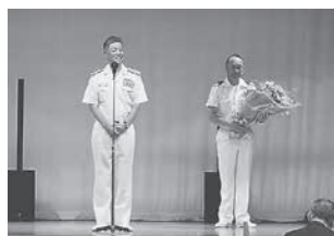
池内掃海隊群司令よりお礼の挨拶