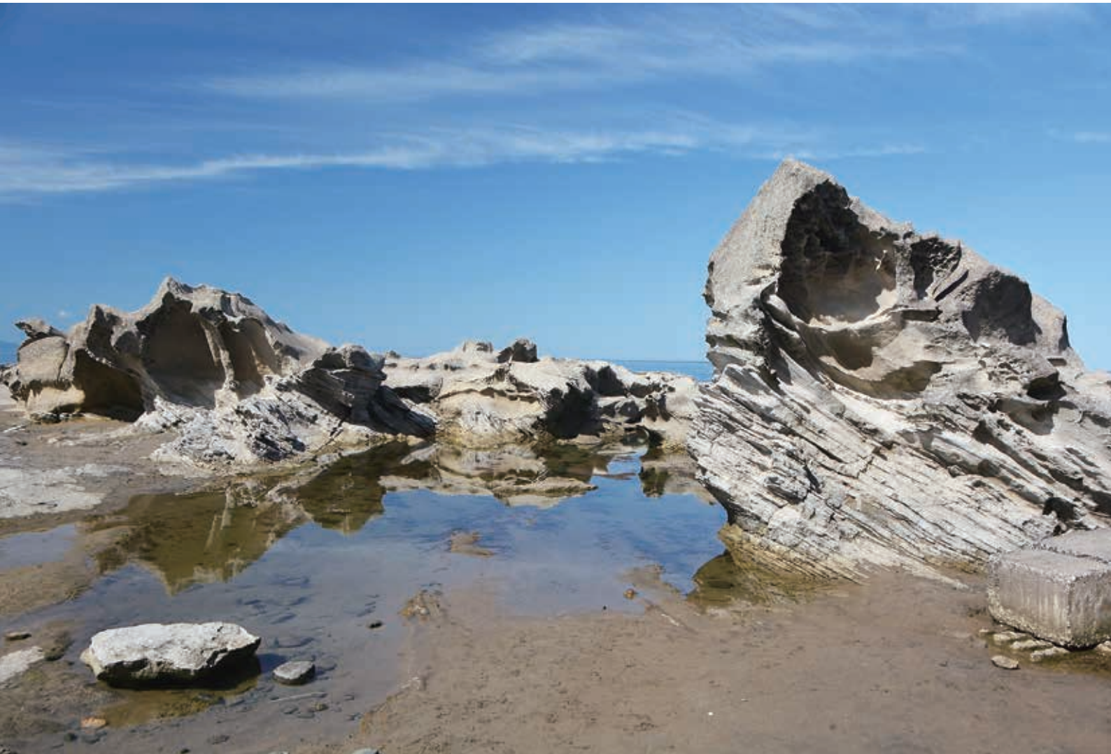
<今月の一枚> ちぢり浜 (むつ市)