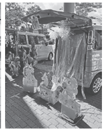
トランクオアトリート