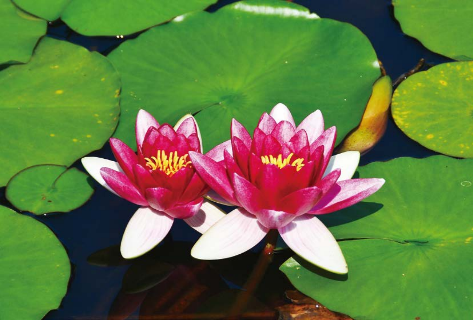
<今月の一枚> 「水源池公園の蓮の花」(むつ市)