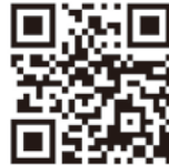
むつ来さまい館 ホームページ

会場／むつ来さまい館 実施日程、体験料は体験メニューによって異なります。詳しくはむつ来さまい館HPをチェックいただくか、小学校、保育園等で配布のチラシをご確認ください。