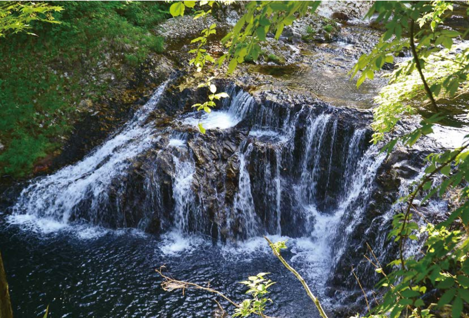
<今月の一枚> 「初夏の川内川溪谷」(むつ市川内町)