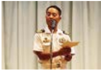
天野第3掃海隊司令よりお礼の挨拶