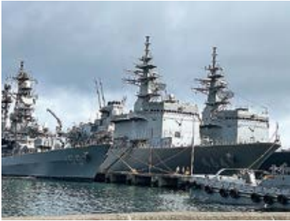
大湊港に入港した掃海母艦ぶんご＝総監部第一突堤(撮影：7月14日)