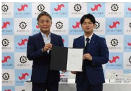
内田会頭(左)と東通村商工会小寺会長(右)

今後は、職員間の交流促進や事業者支援のノウハウ共有、求人の新たな仕組みのほか、原子力産業を担う事業者への支援強化に協力して取り組むことなどを検討している。