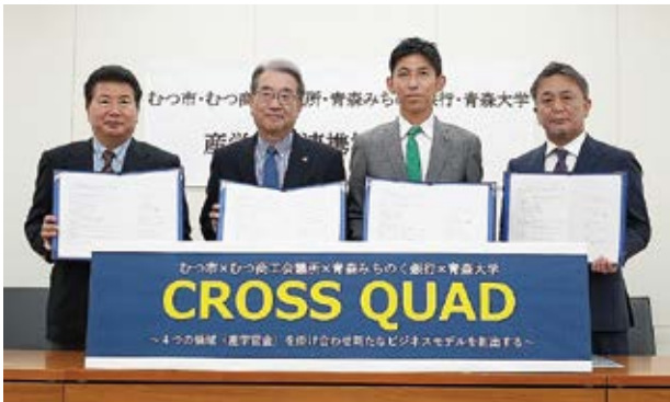
連携協定の愛称は「CROSS QUAD(クロス クアッド)」 4つの領域を掛け合わせ新たなビジネスモデルを創出する。

当所では3者と知識、経験などを共有し、企業間ネットワーク構築、情報提供などに取り組んでいく。