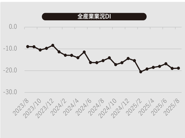
業況DI ※DI=「好転」の回答割合-「悪化」の回答割合