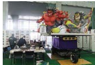
ネプタ絵体験とミニネプタ展示