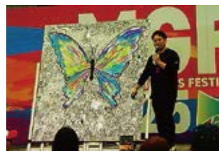
GOMA ライブアートフィナーレ