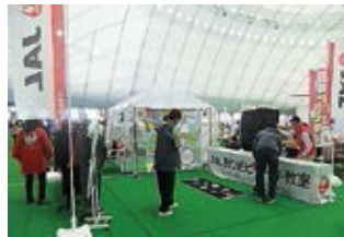
日本航空(株)青森支店