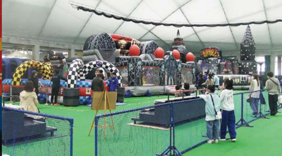
<今月の一枚> 大盛況のMGF(むつ市)