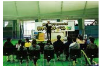
科学フェスティバル