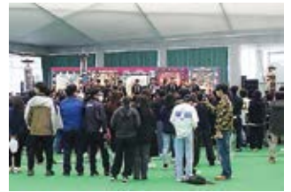
田名部五町によるフィナーレ