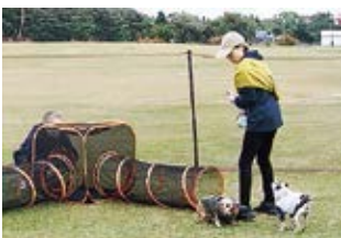
新企画 ドッグラン