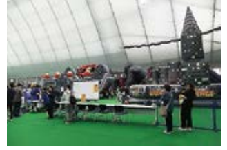
ふわふわ遊具パーク