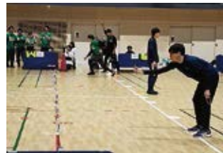
新種目「昭和へGO!トライアスロンリレー」