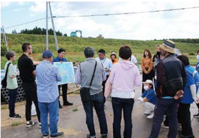
県職員による事業説明の様子

今回見学した箇所を含む「(仮)横浜・横浜吹越IC間」及び「(仮)むつ奥内・むつ東通IC間」は来年3月14日(土)の開通が発表されている。当該区間については開通を記念して11月24日(月・休日)にプレイベントを開催予定。