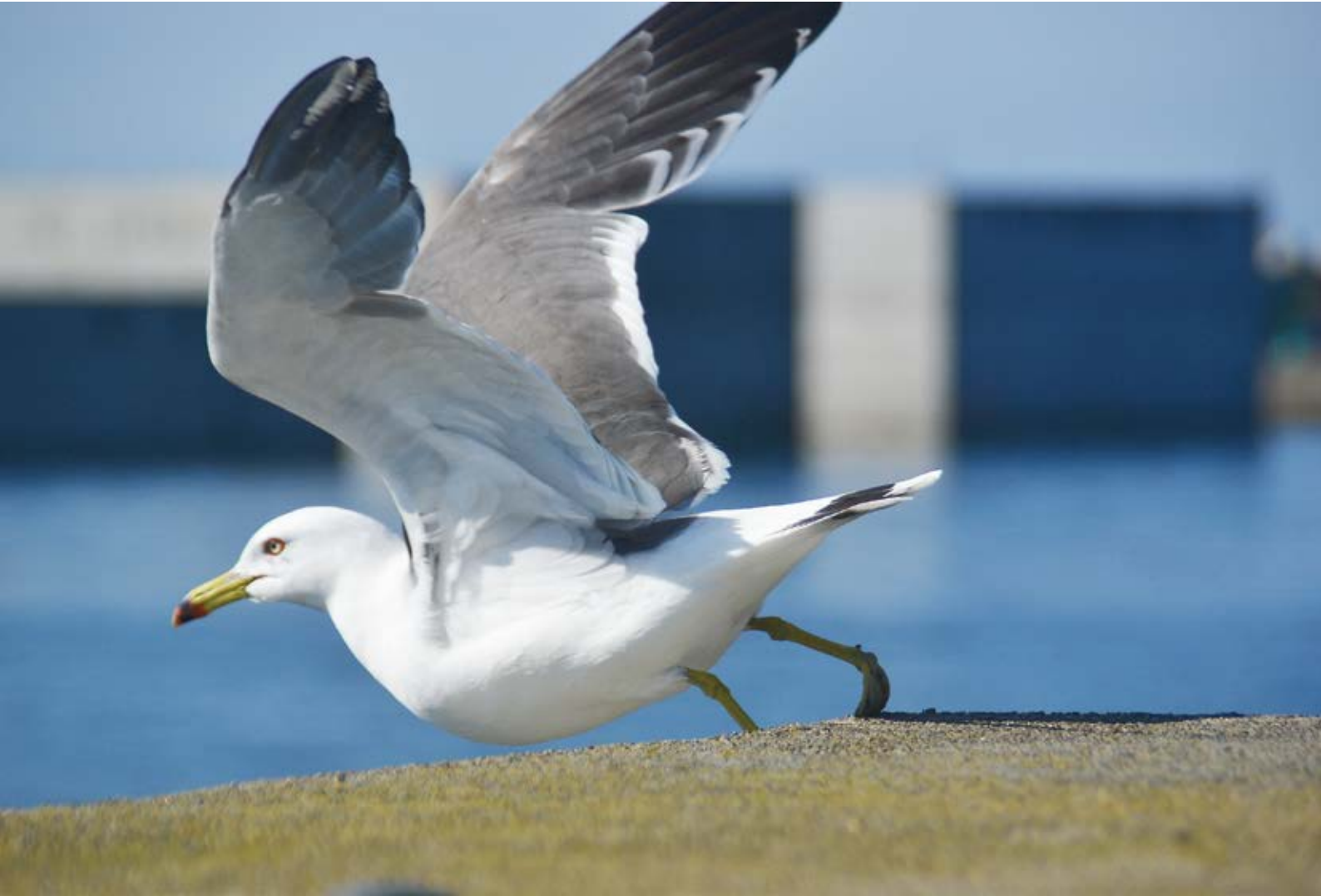
<今月の一枚> 「大海原に飛び立つうみねこ」 (佐井村)