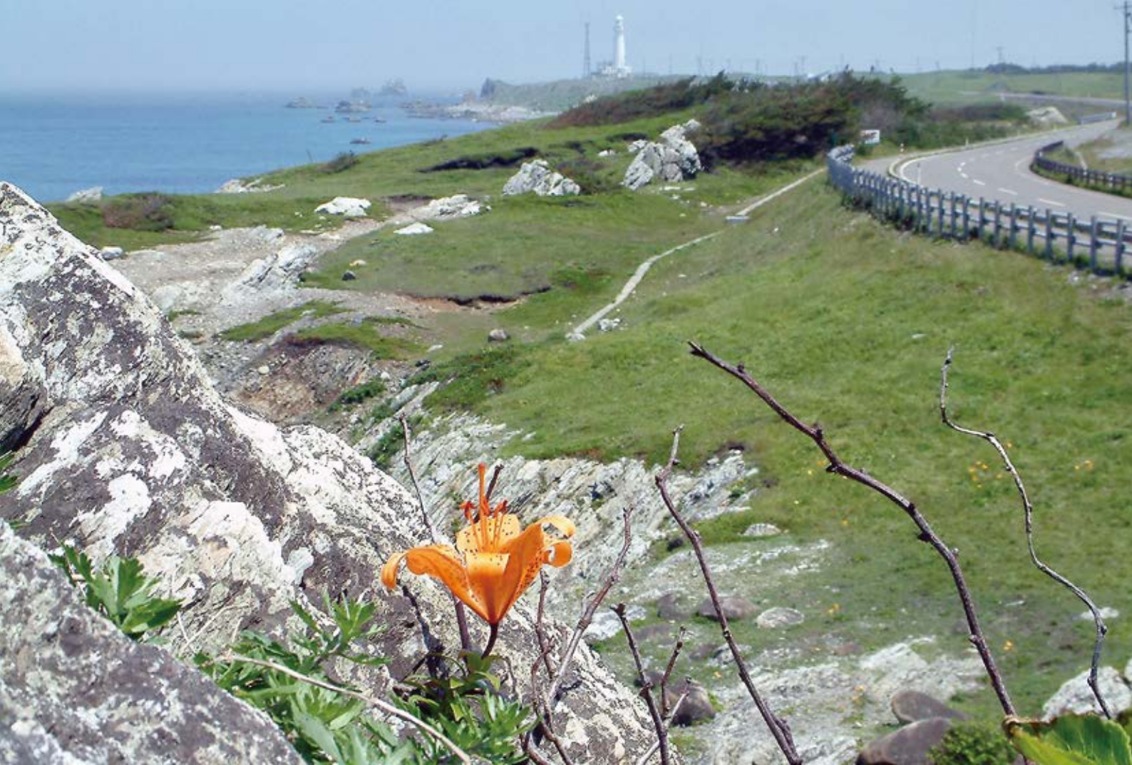
<今月一枚> 「スカシユリと尻屋崎灯台」 (東通村)