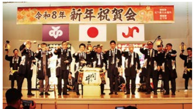
鏡開き／柳町共進組