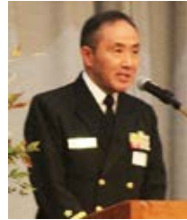
来賓祝辞／稲田総監