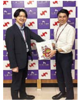
ご利用ありがとうございました