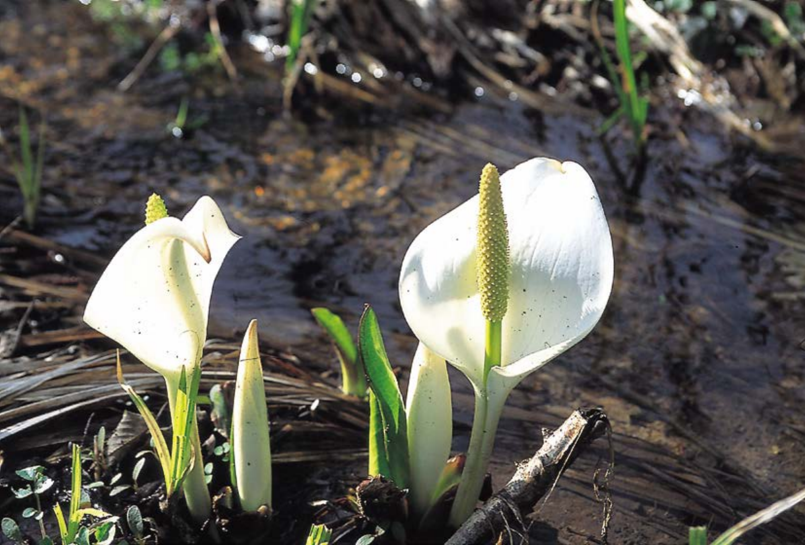
<今月一枚> ミズバショウ (東通村)